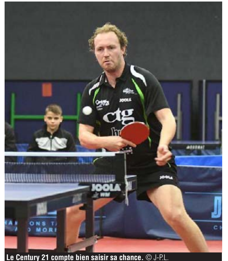
Le Century 21 compte bien saisir sa chance.