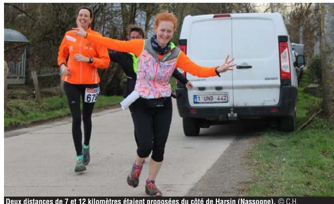
Deux distances de 7 et 12 kilomètres étaient proposées du côté de Harsin (Nassogne).

Pour Benoît, qui couvre les événements running pour divers médias régionaux, ce jogging était une grande première. « J'ai l'habitude de courir depuis environ 5 ans mais je n'avais encore jamais organisé de course à pied, avec chronométrage. C'était l'occasion de relever le défi et de faire plaisir